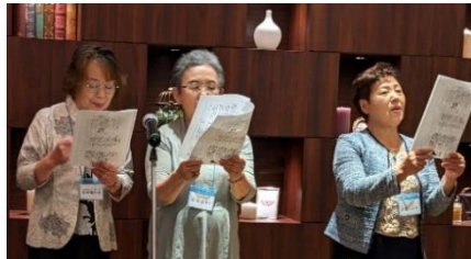
忘れられないの♪ 帽子があったら…今陽子！