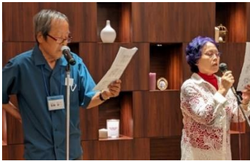
いい湯だな～ハ・ハ・ハン