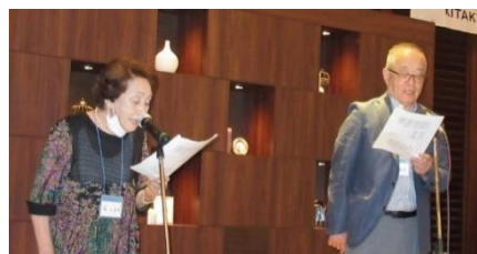
「りんごの歌」は戦後最初の ヒット映画。月給 200 円時代