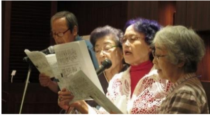
真鍋さん“銀恋”はデュエットだよ～